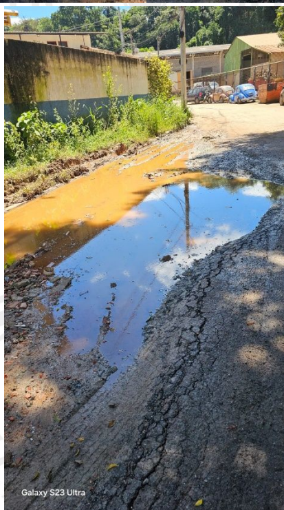
Galaxy S23 Ultra