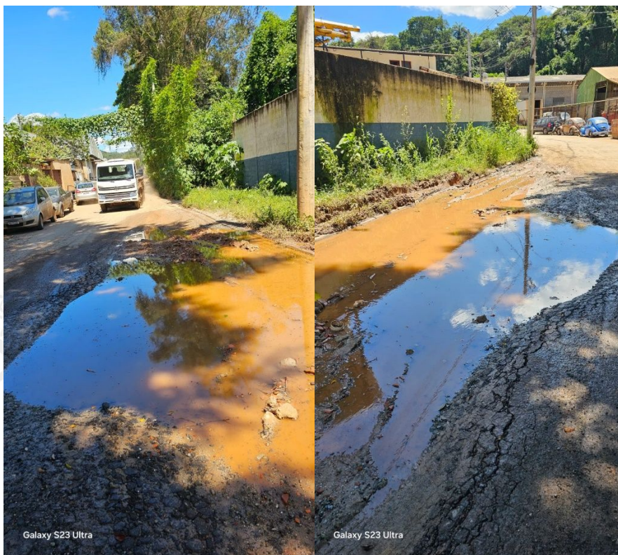
Galaxy S23 Ultra